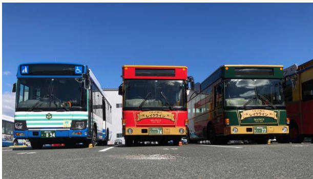
(図1) 松江市交通局バス

なお、今回の取り組みには、NEC ネクサソリューションズ株式会社（代表取締役執行役員社長：木下孝彦）の「バスナビゲーションシステム for SaaS」を使用しており、本システムから GTFS-JP (注2) および GTFS リアルタイムのデータを提供しています。